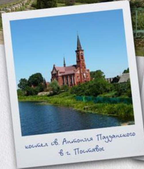
коштел св. Антонія Паздзанскаго в г. Поставы